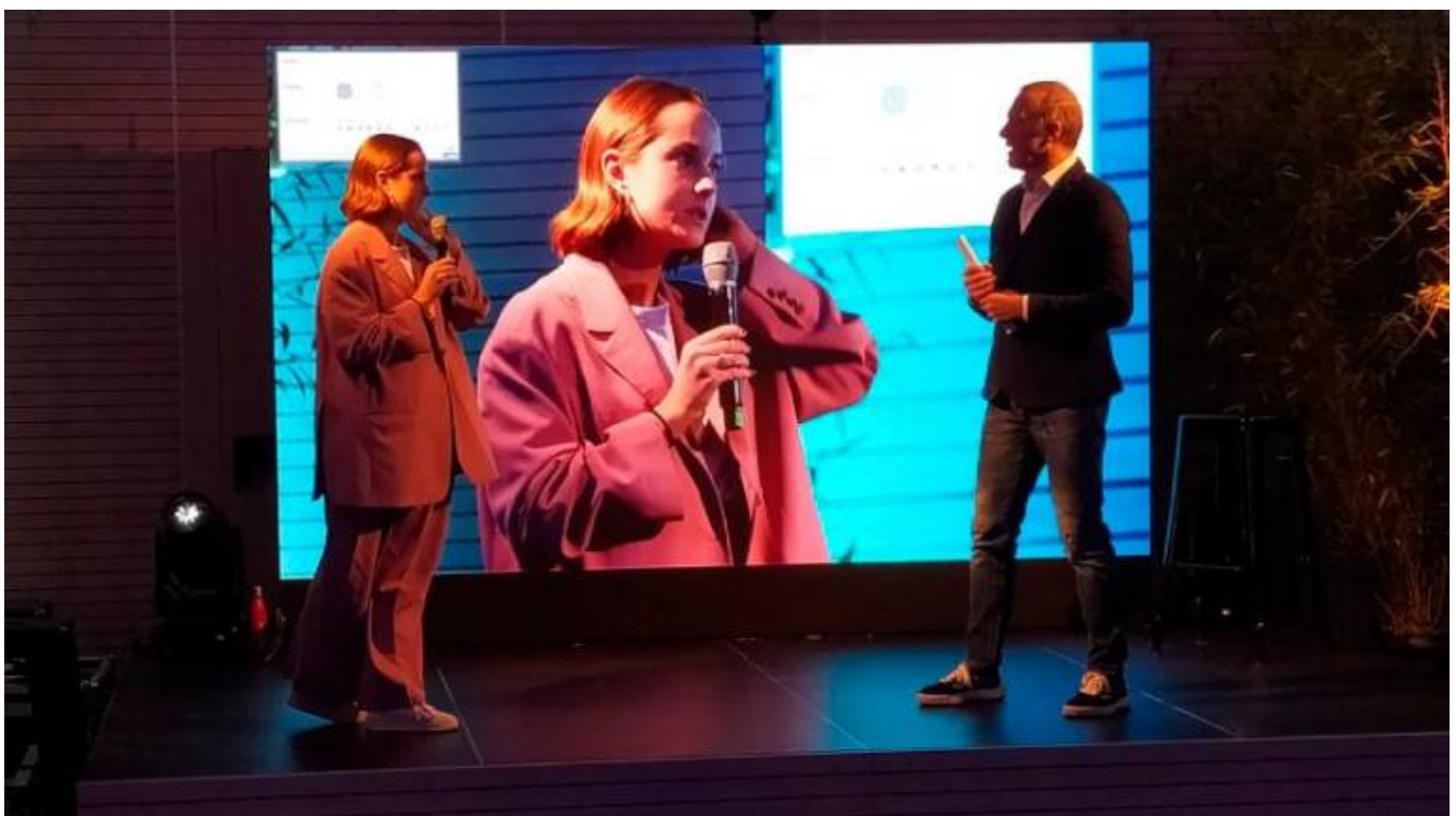
Il premio a Opinia AApp